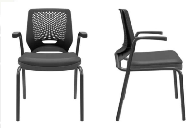
Modelo: Beezi – Marca Plaxmetal

Obs.: O modelo e marca deverão ser seguidos por questões de padronização.