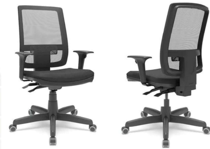
Modelo: Brizza Presidente – Marca Plaxmetal

Obs.: O modelo e marca deverão ser seguidos por questões de padronização.