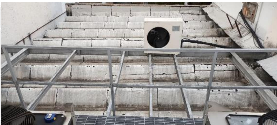
Figura 4 - Prolongamento da plataforma – vista posterior