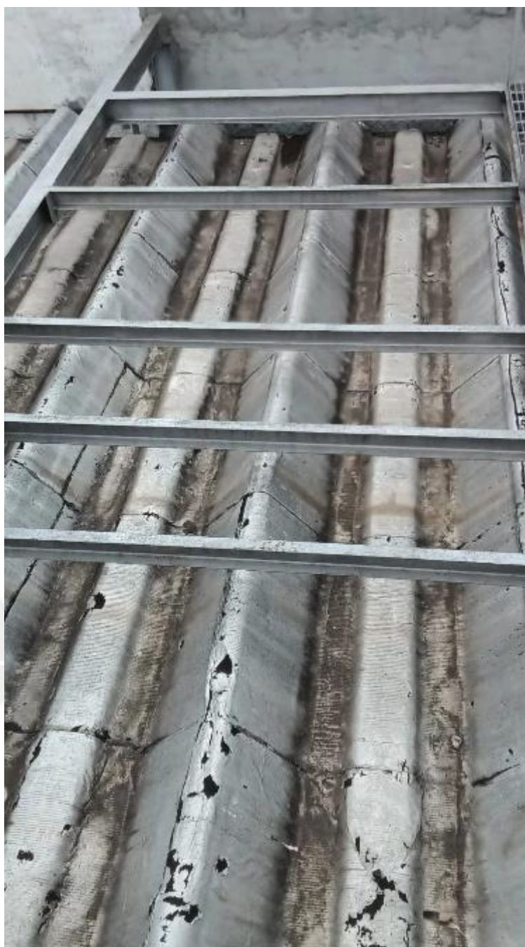
Figura 5 - Prolongamento da plataforma – vista lateral