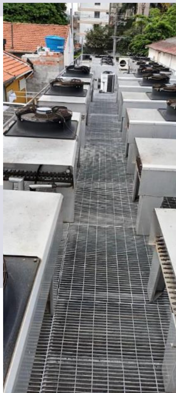
Figura 3 - Vista posterior