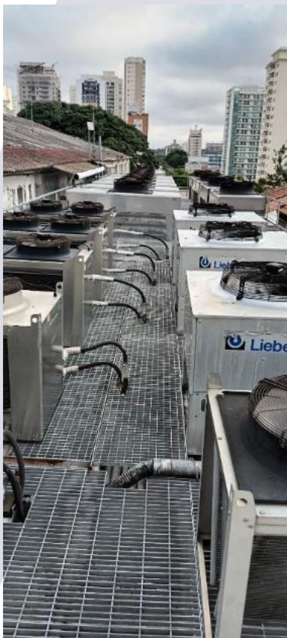
Figura 2 - vista frontal